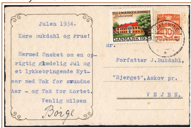
Julekort med Lindersvold på julemærket 1934